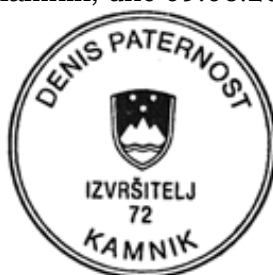
IZVRŠITELJ - Denis PATERNOST