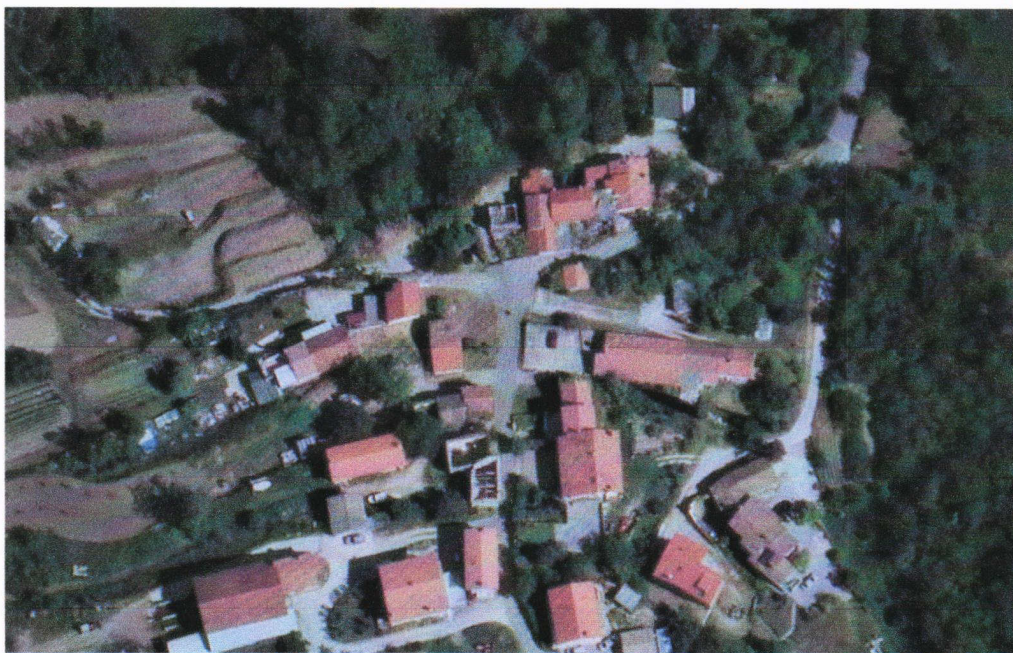
Lokacija na naslovu Potok 9

Ocenjevane nepremičnine se nahajajo na lokaciji Potok v krajevni skupnosti Sv. Anton, na območju Mestne občine Koper.