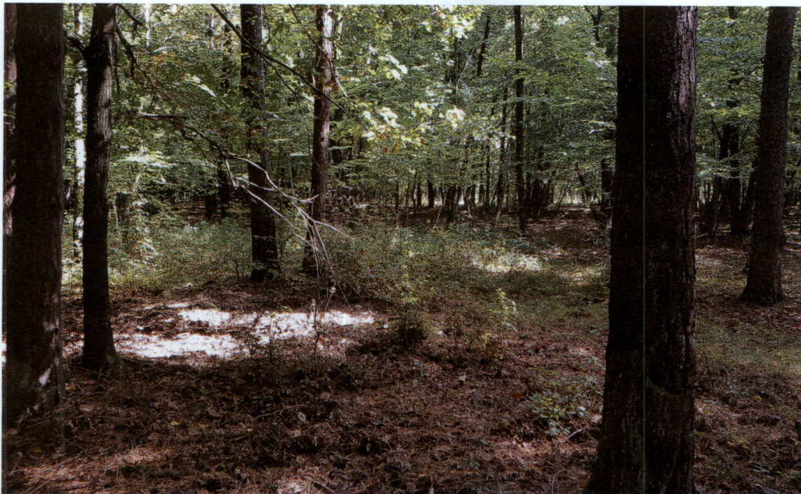
Slika 1: K.o. Hodoš, parc. št. 112/1