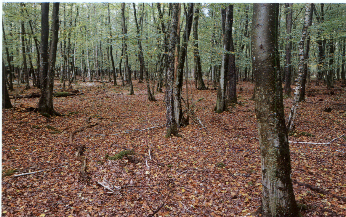
Slika 2: K.o. Hodoš, parc. št. 112/1