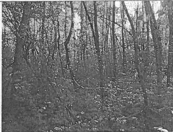
Parcela ID 1723-2159