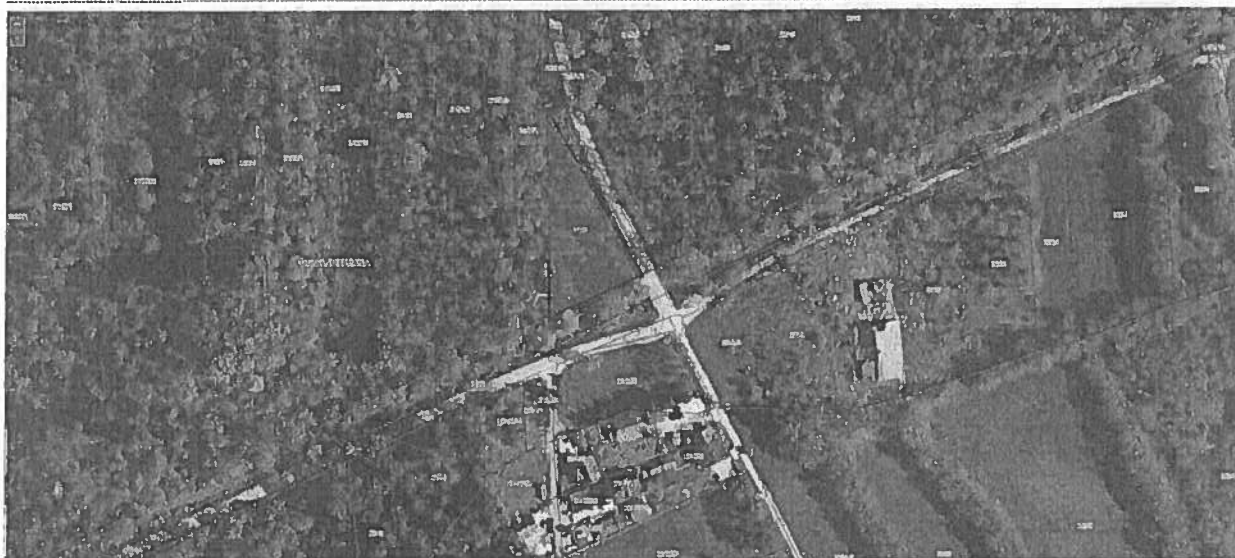
Slika 1: Slika parcele št. 2155, k.o. Vič