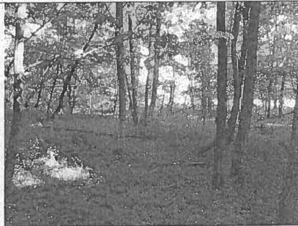
Parcela ID 1723-2246