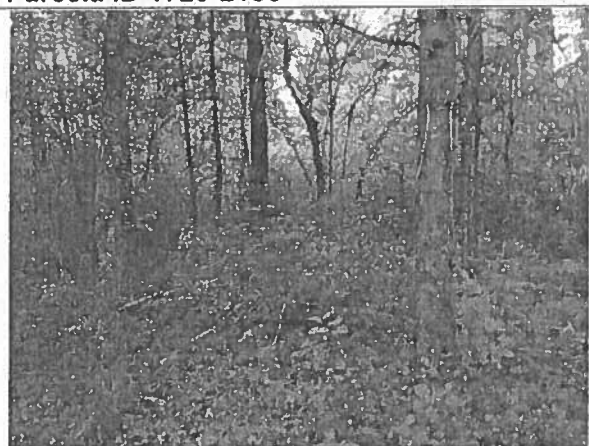
Parcela ID 1723-2123/1