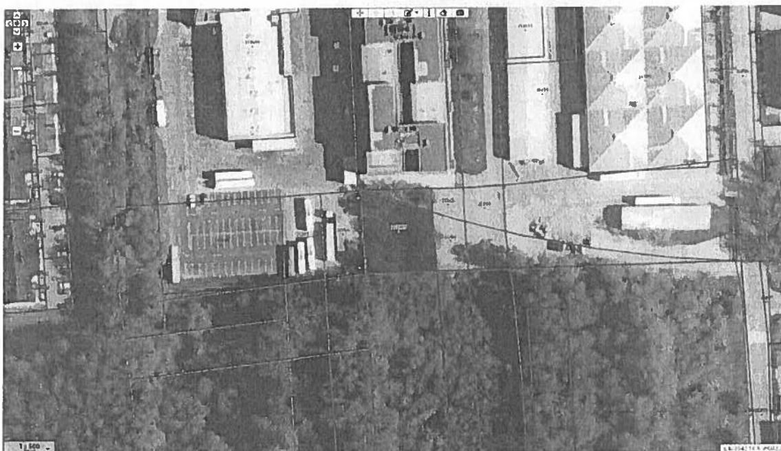
Slika 7: Slika oddeljene parcele št. 2123/17, k.o. Vič