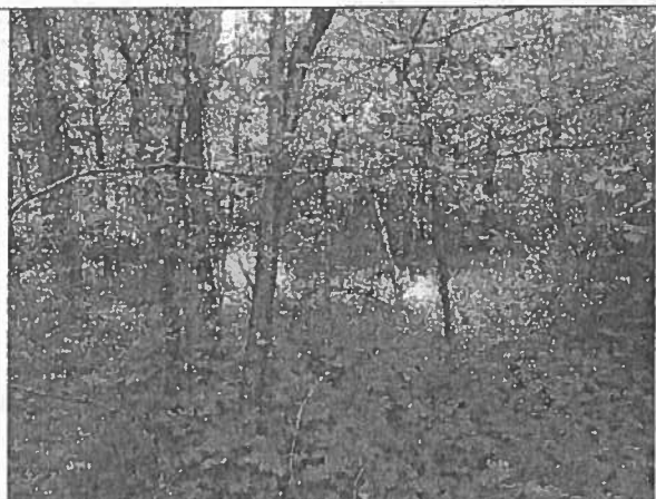
Parcela ID 1723-2155