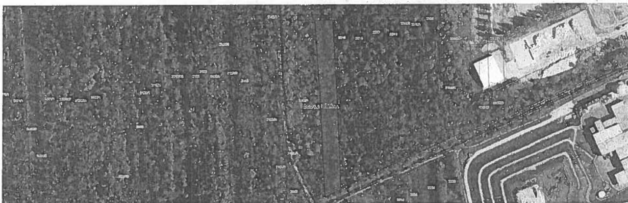
Slika 3: Slika parcele št. 2159, k.o. Vič