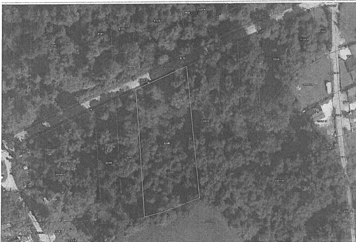
Slika 8: Slika parcele št. 2246, k.o. Vič