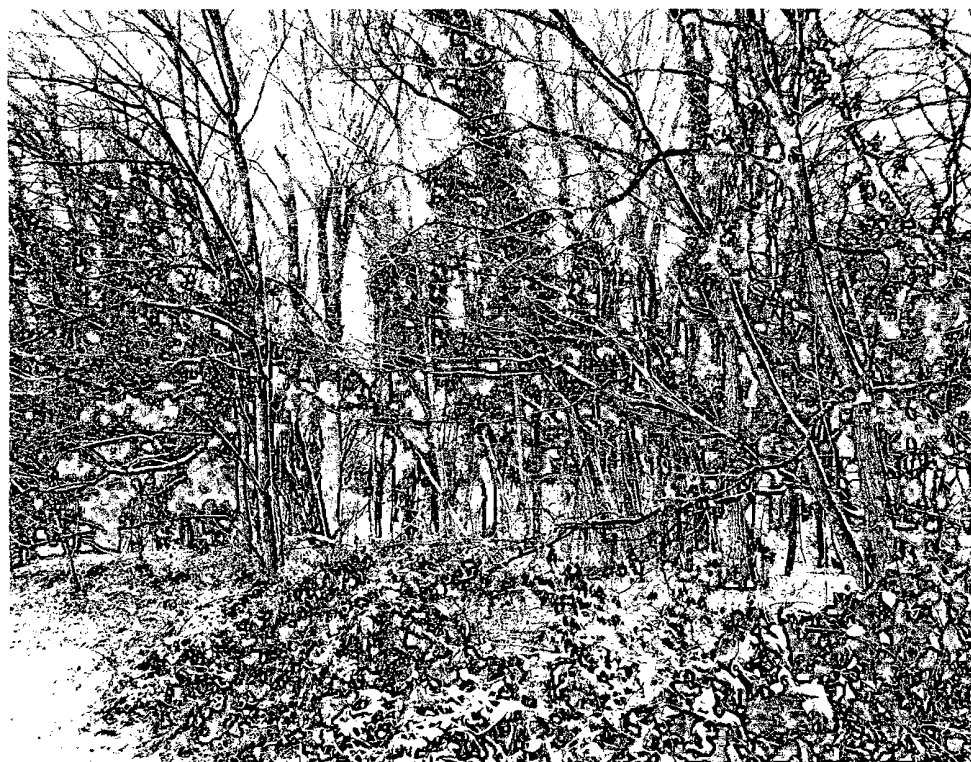
Slika 2: k.o. Križevci, parc, št. 7136