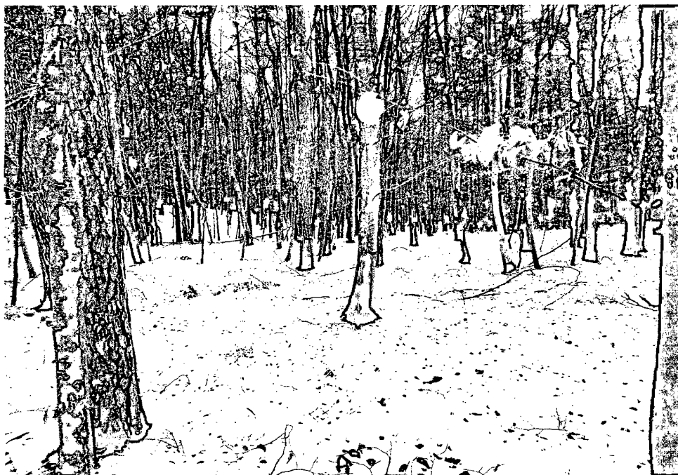
Slika 1: k.o. Križevci, parc, št. 7354