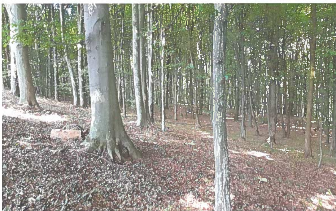
Slika 2: K.o. Terbegovci, parc. št. 628/2