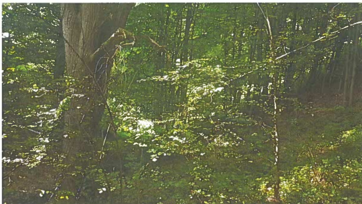
Slika 3: K.o. Terbegovci, parc. št.392/3