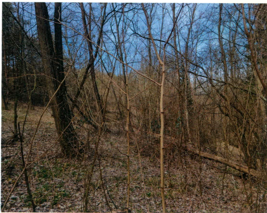
Slika 5: K.o. Neradnovci, parc. št. 1421