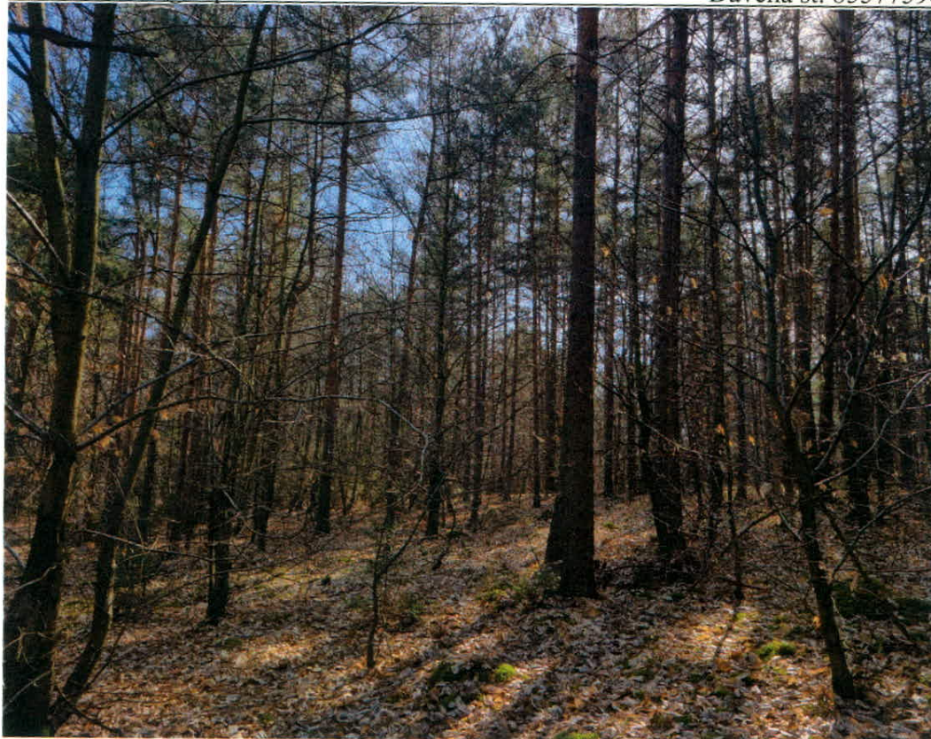
Slika 1: K.o. Neradnovci, parc. št. 428