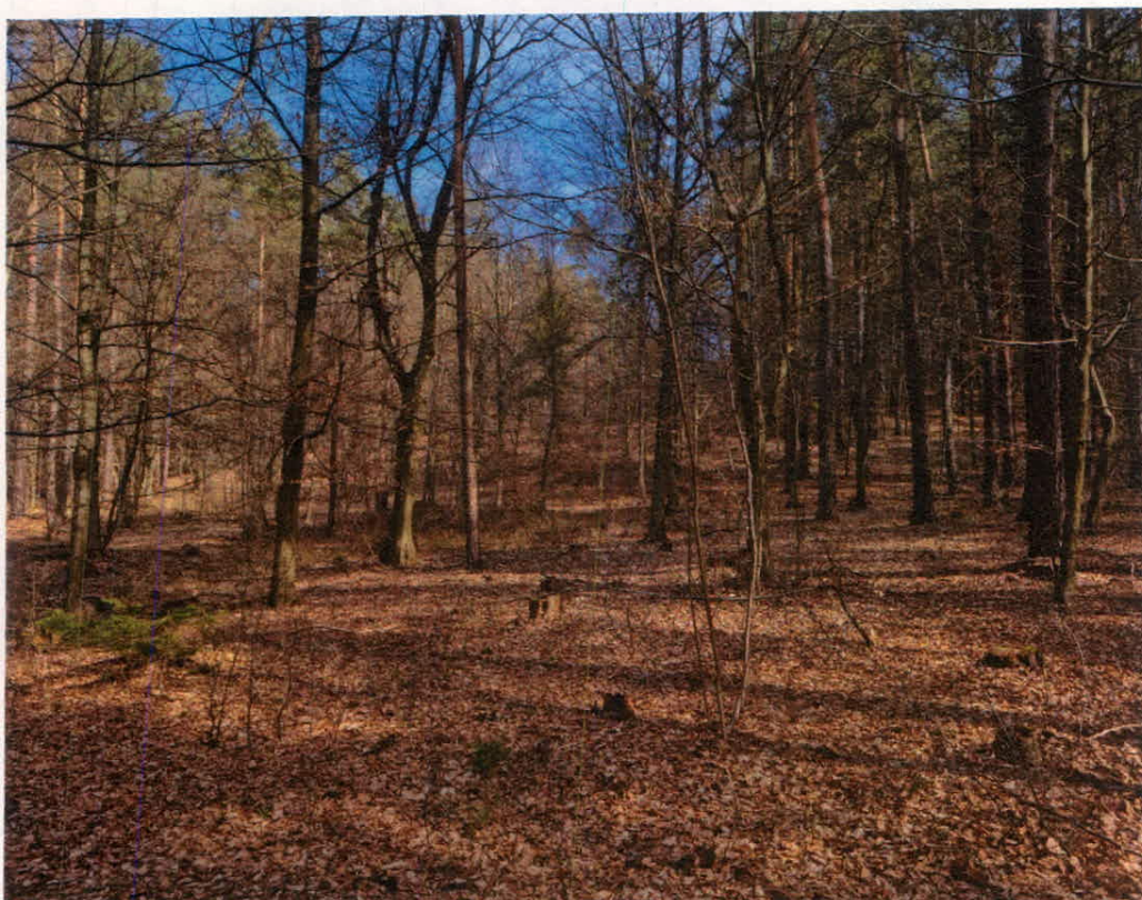
Slika 4: K.o. Neradnovci, parc. št. 586