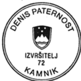
IZVRŠITELJ - Denis PATERNOST