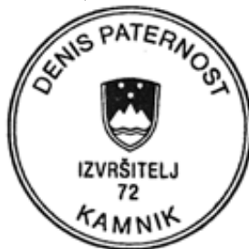
IZVRŠITELJ - Denis PATERNOST