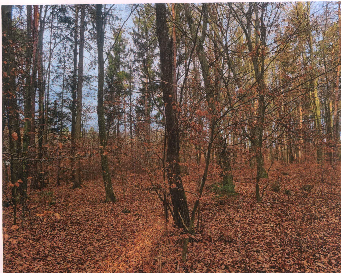
Slika 1: k.o. Krašči, parc, št. 1236