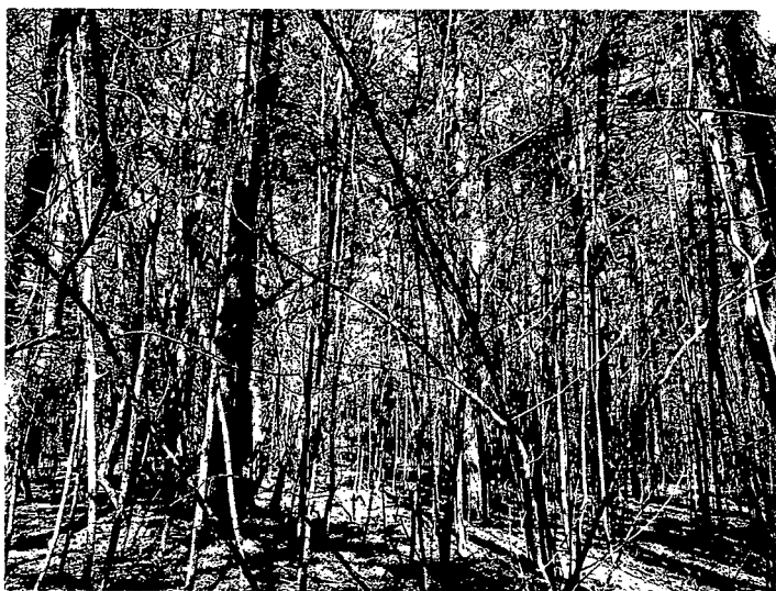
Slika 4: Gozdna parcela št. 861/8