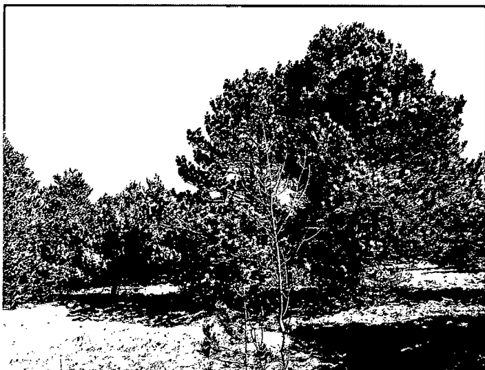
Slika 2: Gozdna parcela št. 818 k.o. Famlje