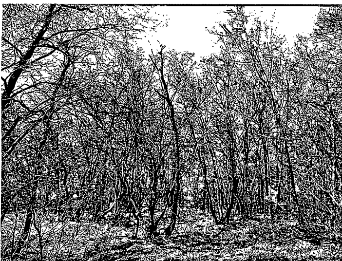
Slika 1: Gozdna parcela št. 812 k.o. Famlje