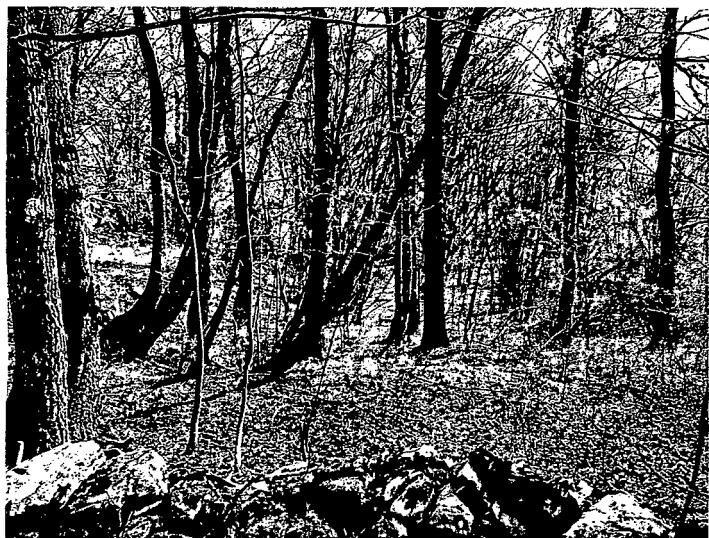
Slika 3: Gozdna parcela št. 828 k.o. Famlje