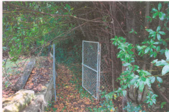
Prehod proti parceli 2403