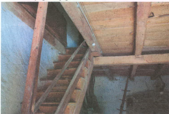
stavba 67 – pritličje