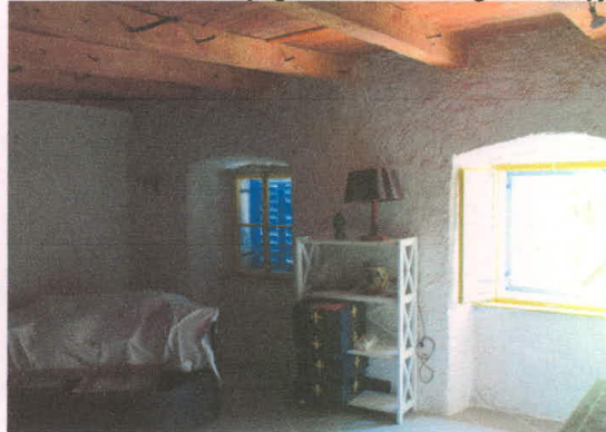
stavba 67 - prvo nadstropje