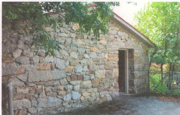
Stavba 66 – zahodni del nadstropja