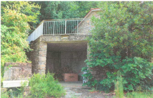
Stavba 66 – jugozahodni del