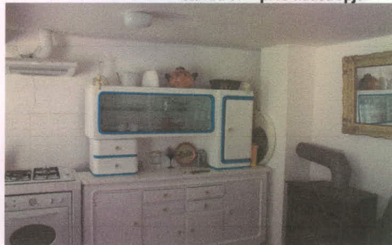
stavba 67 – zgornje, drugo nadstropje