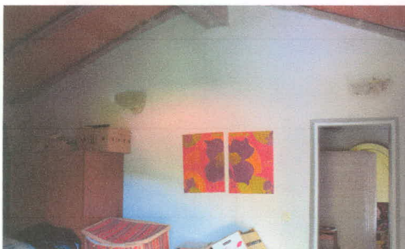
Stavba 66 – prenovljeno nadstropje