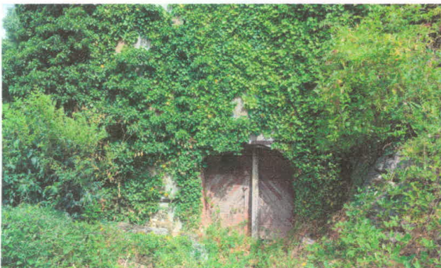
Stavba 66, vhod v kletno etažo