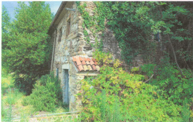
Stavba 66 – pogled z vzhoda

Stavba št. 66 stoji na parceli št. 3159. Neto tlorisna površina stavbe št. 66 znaša 105,00 m 2 , S(66) = 105,00 m 2 .