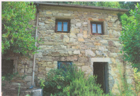
Stavba 66 – pogled z juga