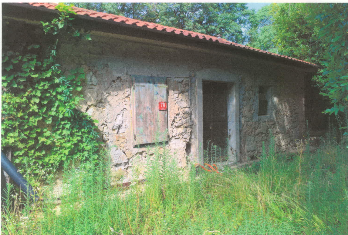
Stavba 65, pogled s severovzhoda