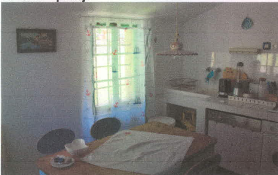
stavba 67 – zgornje, drugo nadstropje