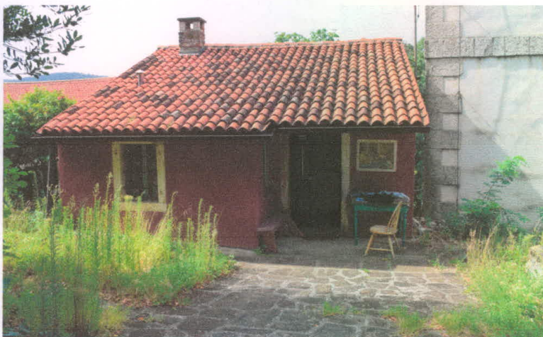
Stavba 67 – pogled s severa – drugo nadstropje