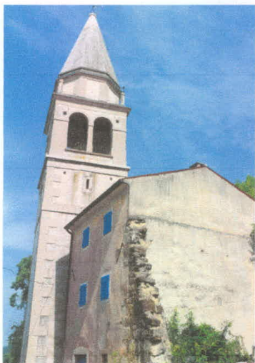
Stavba 67 – pogled s jugovzhoda

Stavba stoji na parceli št. 3159. Neto tlorisna površina stavbe št. 67 znaša 90,00 m 2 , S(67) = 90,00 m 2